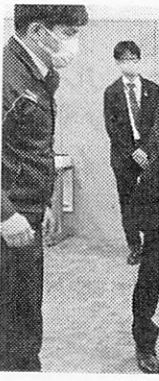
機能の説 押す大松